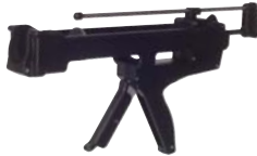
STV345用インジェクションガン