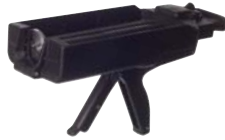
CRE385用インジェクションガン